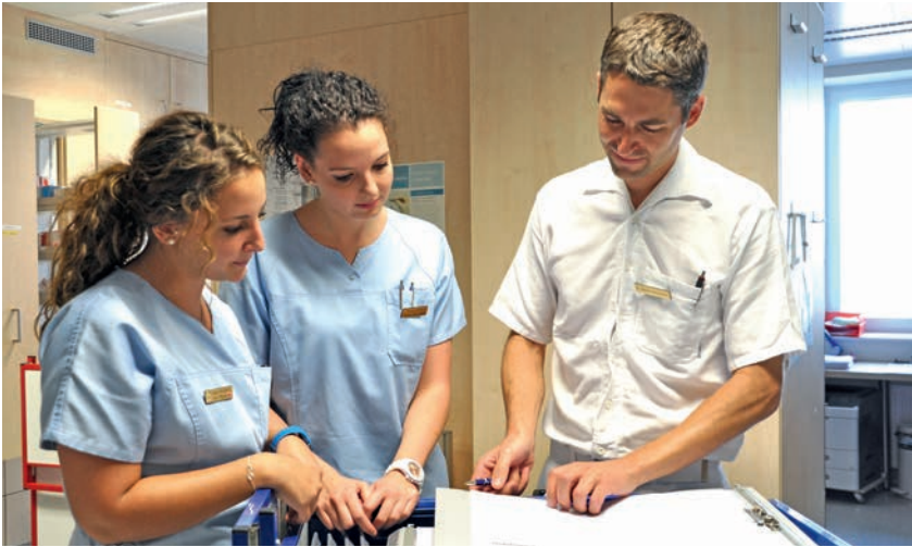
Pflegeausbildung im Uniklinikum Salzburg